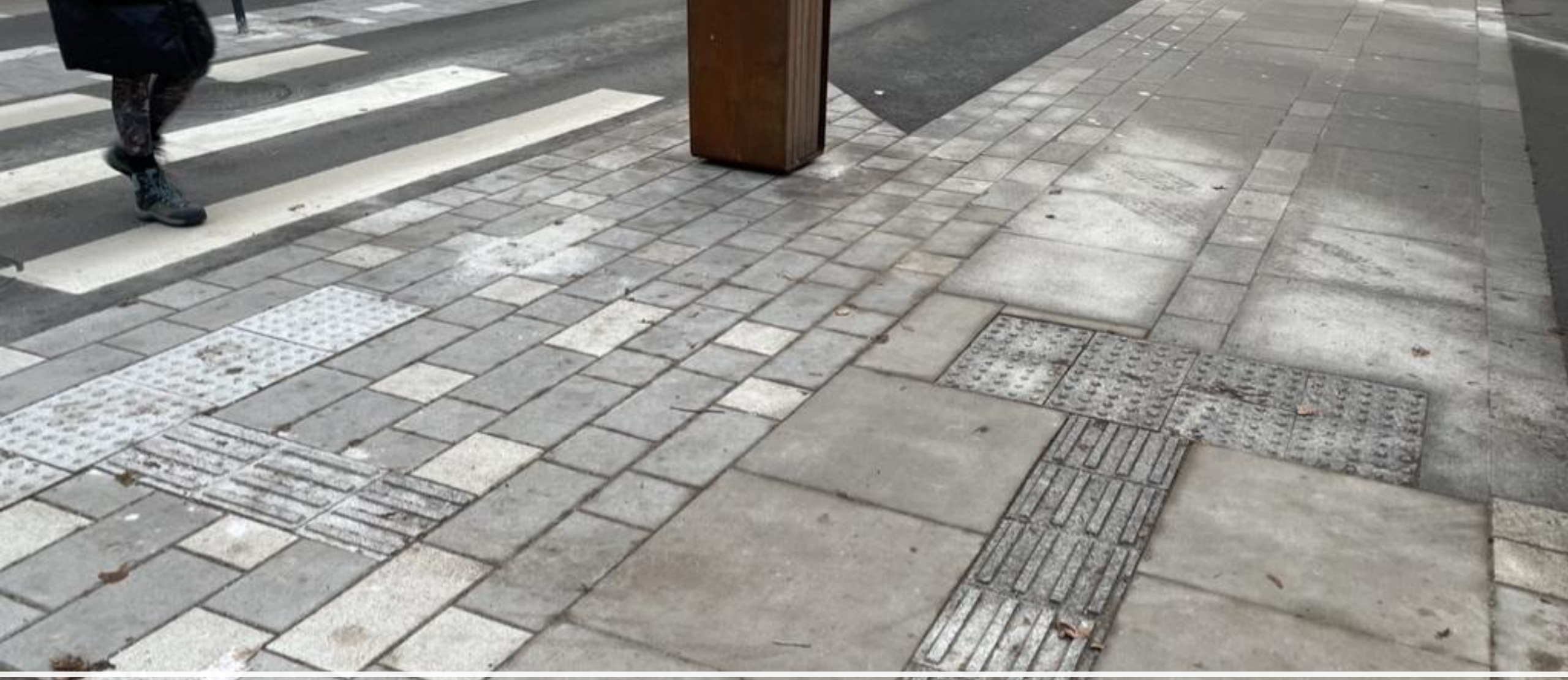
Auhinnatud Vana-Kalamaja tänav